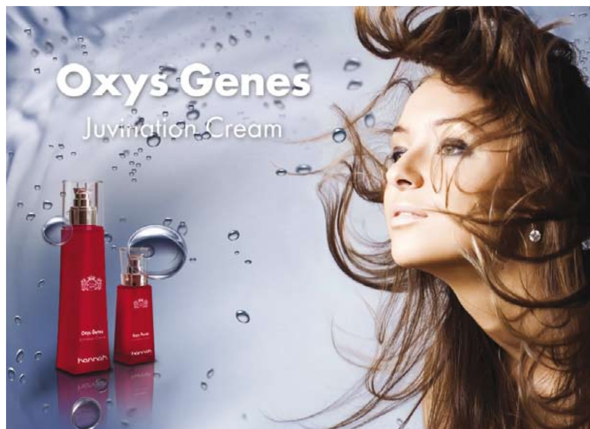
Nieuw: hannah Oxys Genes.